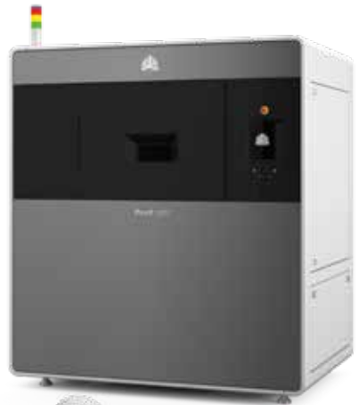
Verteiler gedruckt in DuraForm ProX FR1200