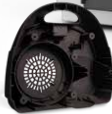
Rückseitige Staubsaugerabdeckung, gedruckt in DuraForm EX Black