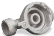
Schlauchanschluss gedruckt in DuraForm ProX GF

Geringere Gesamtbetriebskosten durch automatisierte Produktionswerkzeuge, einen bemerkenswert hohen Durchsatz, hohe Werkstoffeffizienz und Wirtschaftlichkeit.