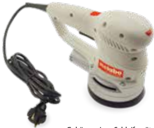
Gehäuse eines Schleifgeräts, gedruckt im Werkstoff DuraForm PA

Die sPro SLS Anlagen fertigen hochaufgelöste, langlebige Thermoplastteile in mittleren bis großen Baugrößen.