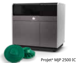
Projeto MJ2500 IC

Gerando produtividade e novas eficiências de fabricação com a produção de padrões de fundição impressos em 3D da 3D Systems