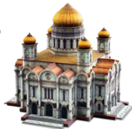
Modelos arquitetônicos em grande escala podem ser impressos em uma única peça