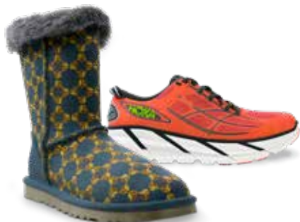
As peças da CJP representam de modo realista a intenção de design do produto final; Cortesia da Decker Brands

Acesse impressão 3D completamente colorida com a impressora ProJet CJP 260 Plus acessível e compacta, até a ProJet CJP 860Pro de grande capacidade com um volume de criação de 20 x 15 x 9 pol. (508 x 381 x 229 mm) para criar modelos bem grandes ou volumes altos de protótipos.