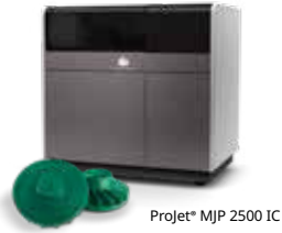
Projet* MJP 2500 IC

Höhere Produktivität und Effizienz in der Fertigung mit werkzeuglosem 3D-Druck für die Gussmodellproduktion von 3D Systems