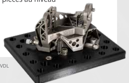
Pièce avec l'autorisation de VDL