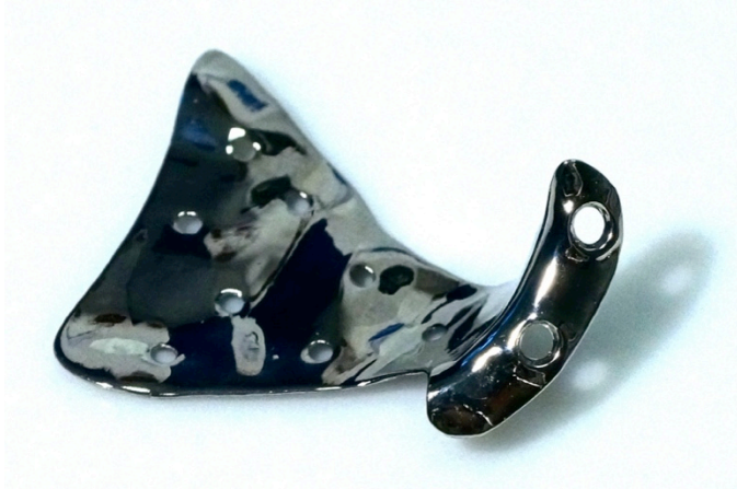
Rekonstruktive Orbitabodenplatte, hergestellt von LayerWise